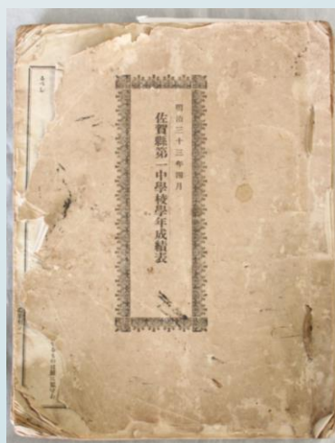
旧制佐賀中学時代の成績表