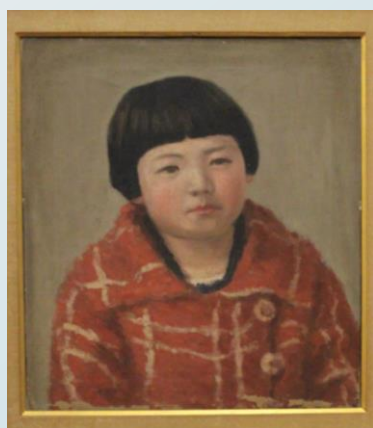
さえ子造/石本秀雄画